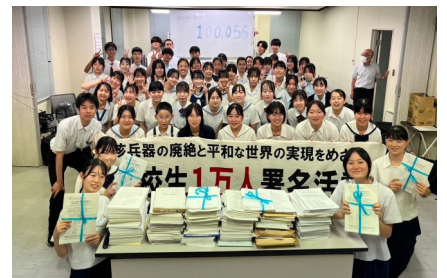
<高校生ナガサキ平和の旅>