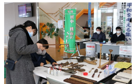
<昨年度の戦中・戦後の暮らし展>