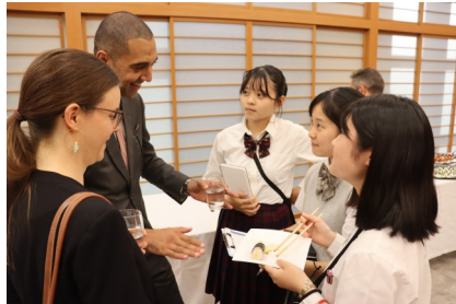
<高校生平和大使スイス訪問>