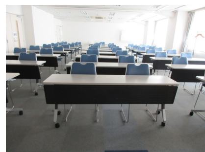
<2階小・中会議室連結時>

☆高校教育会館はどなた様でもご利用できる施設です。 空き状況の確認やお申込みは、事務局までお電話ください。