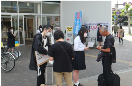
<高校生1万人署名活動>

なお、高校生平和大使は、外務省からユース非核特使としての委嘱や「いわてユネスコ教育賞」を受賞しています。