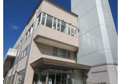
<岩手県高校教育会館 外観>

当法人は教育会館としては全国に類を見ない、高校・特別支援校の関係団体による公益財団法人です。 今後とも公益財団としての使命を発揮し、岩手の教育の発展に寄与していきますので、引き続き皆様方 のご理解とご支援をお願いいたします。