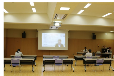
<Web講習会・3階大ホール>

大ホール・中会議室・小会議室・応接室では、インターネット接続（有線・無線）が可能です。料金は会議室料金に含まれておりますので、安心してご利用いただけます。