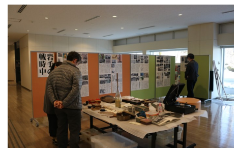
<昨年度の戦中・戦後の暮らし展>