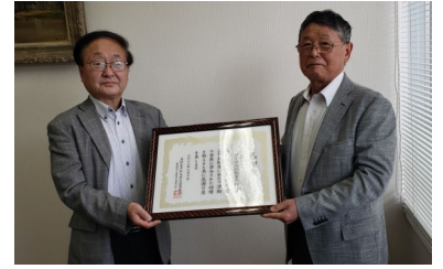
<高校教育会館へ感謝状>

なお、高校生平和大使は、外務省からコース非核特使としての委嘱や「いわてユネスコ教育賞」を受賞しています。