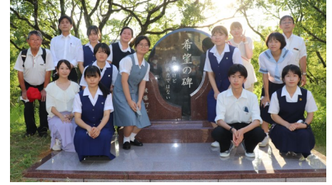
<高校生ナガサキ平和の旅>