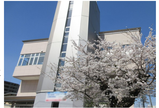
< 岩手県高校教育会館 外観 >

当法人は教育会館としては全国に類を見ない、高校・特別支援校の関係団体による公益財団法人です。今後とも公益財団としての使命を発揮し、岩手の教育の発展に寄与していきますので、引き続き皆様方のご理解とご支援をお願いいたします。