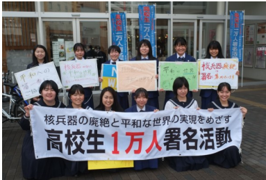
<高校生1万人署名活動>