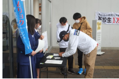
<高校生1万人署名活動>